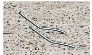
Platten-Aufsicht (Verankerung wird einbetoniert)