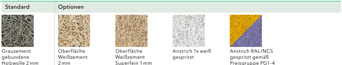
Abbildung oben: Standardversion mit Oberfläche Weißzement