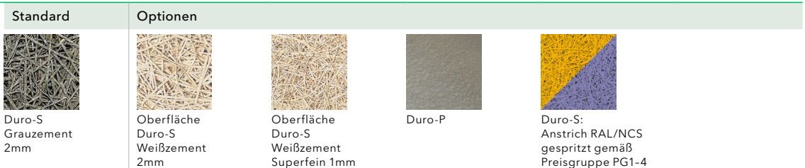
Abbildung oben: Duro-S Weißzement Oberfläche